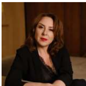
Матвиенко Валерия Александровна